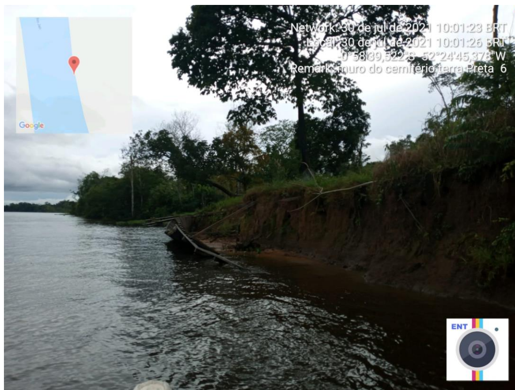
FOTO 01- CEMITÉRIO TERRA PRETA