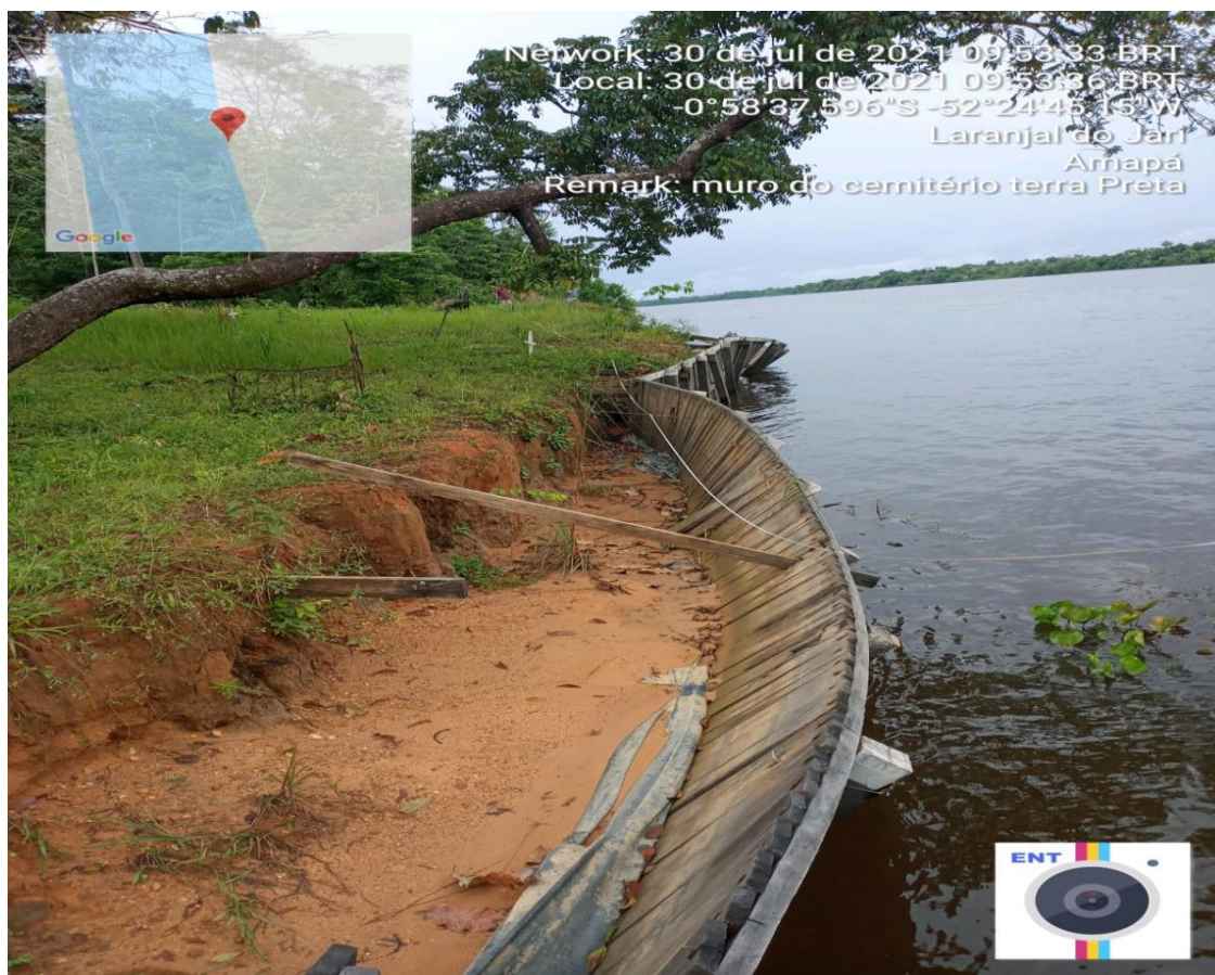
FOTO 06- CEMITÉRIO TERRA PRETA