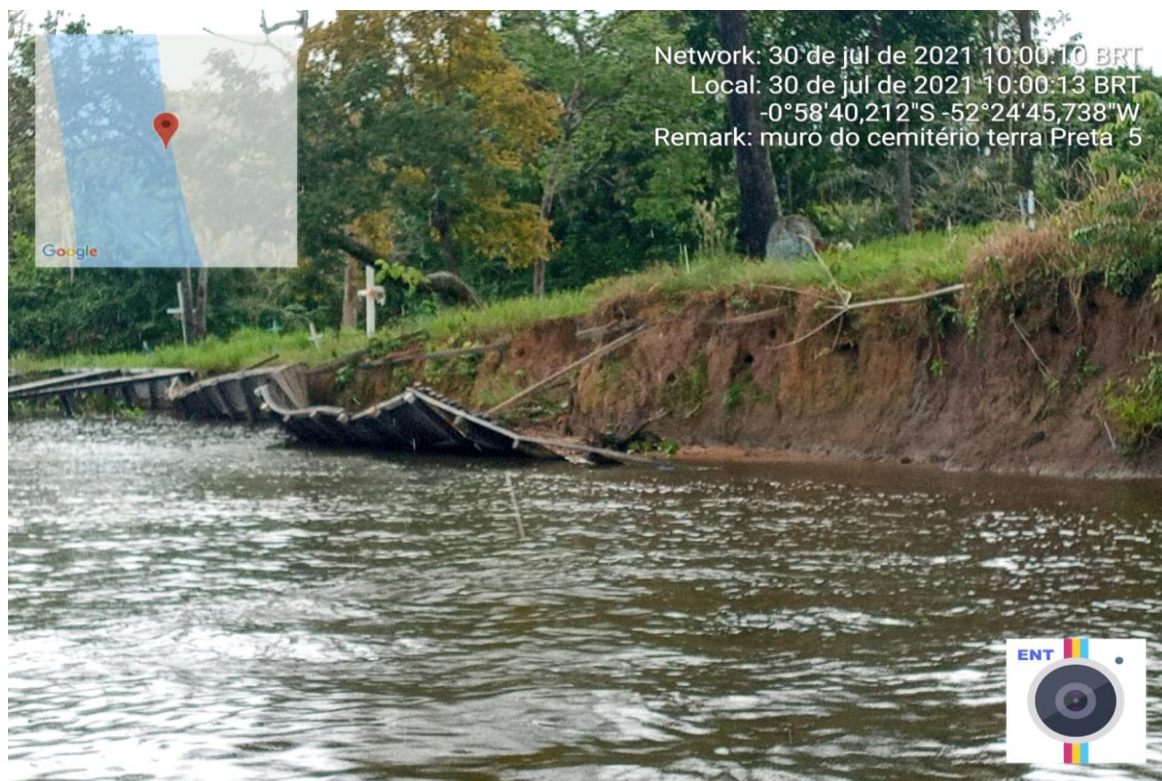
FOTO 05- CEMITÉRIO TERRA PRETA