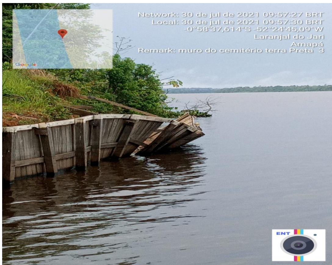
FOTO 10- CEMITÉRIO TERRA PRETA