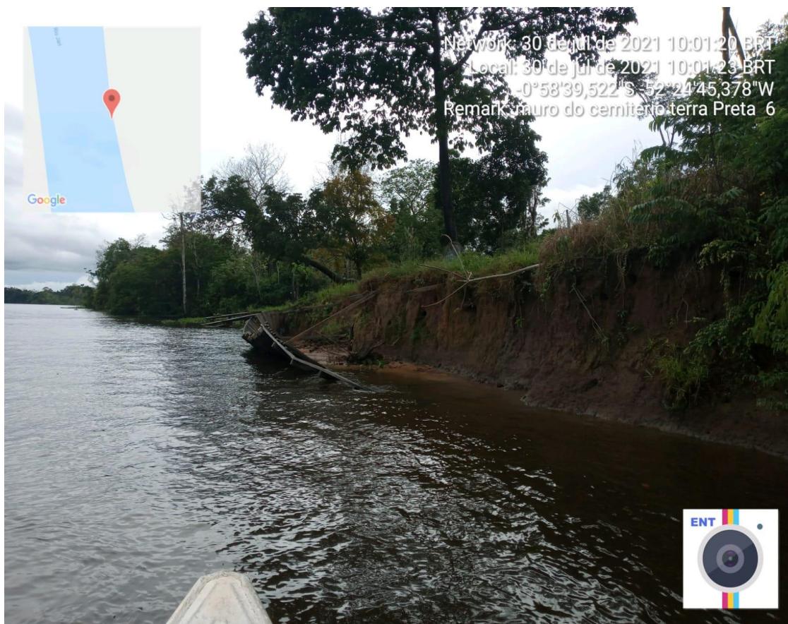
FOTO 04- CEMITÉRIO TERRA PRETA