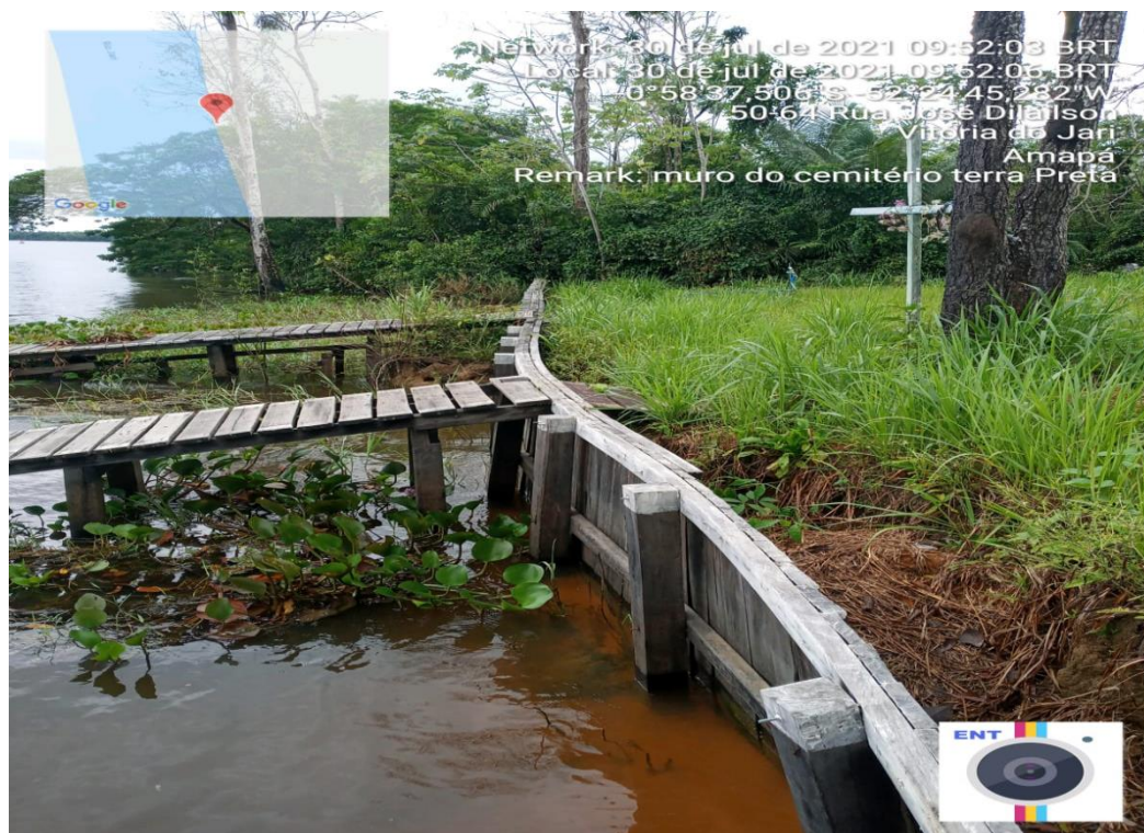
FOTO 02- CEMITÉRIO TERRA PRETA