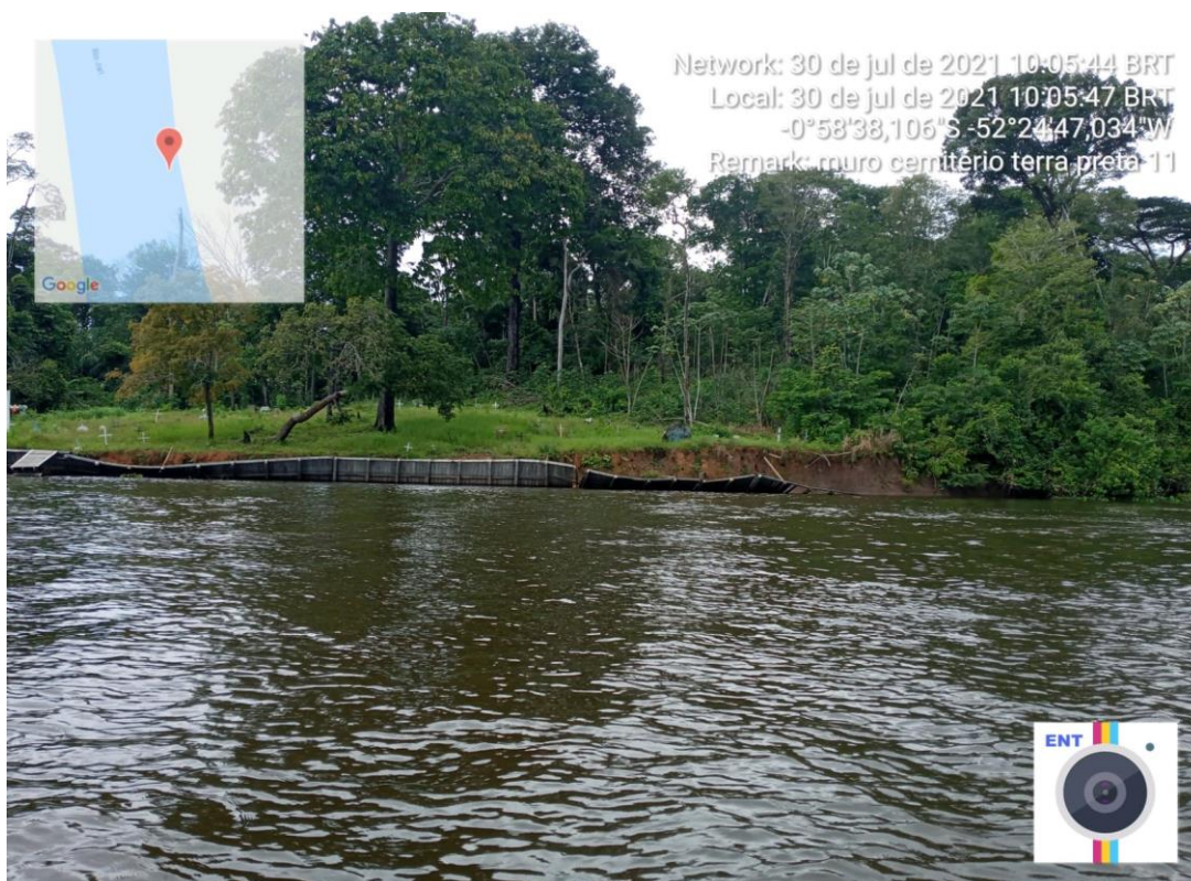
FOTO 09- CEMITÉRIO TERRA PRETA