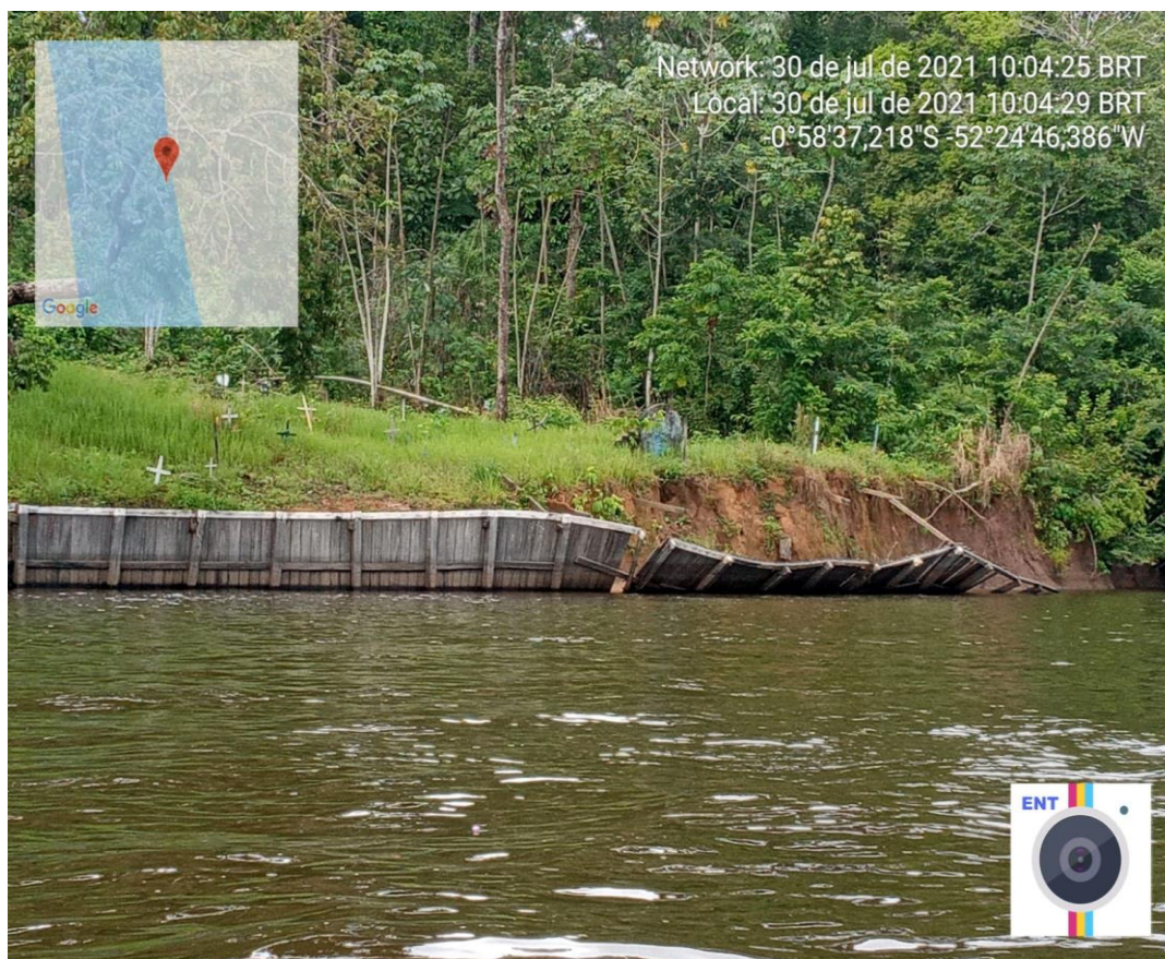
FOTO 08- CEMITÉRIO TERRA PRETA