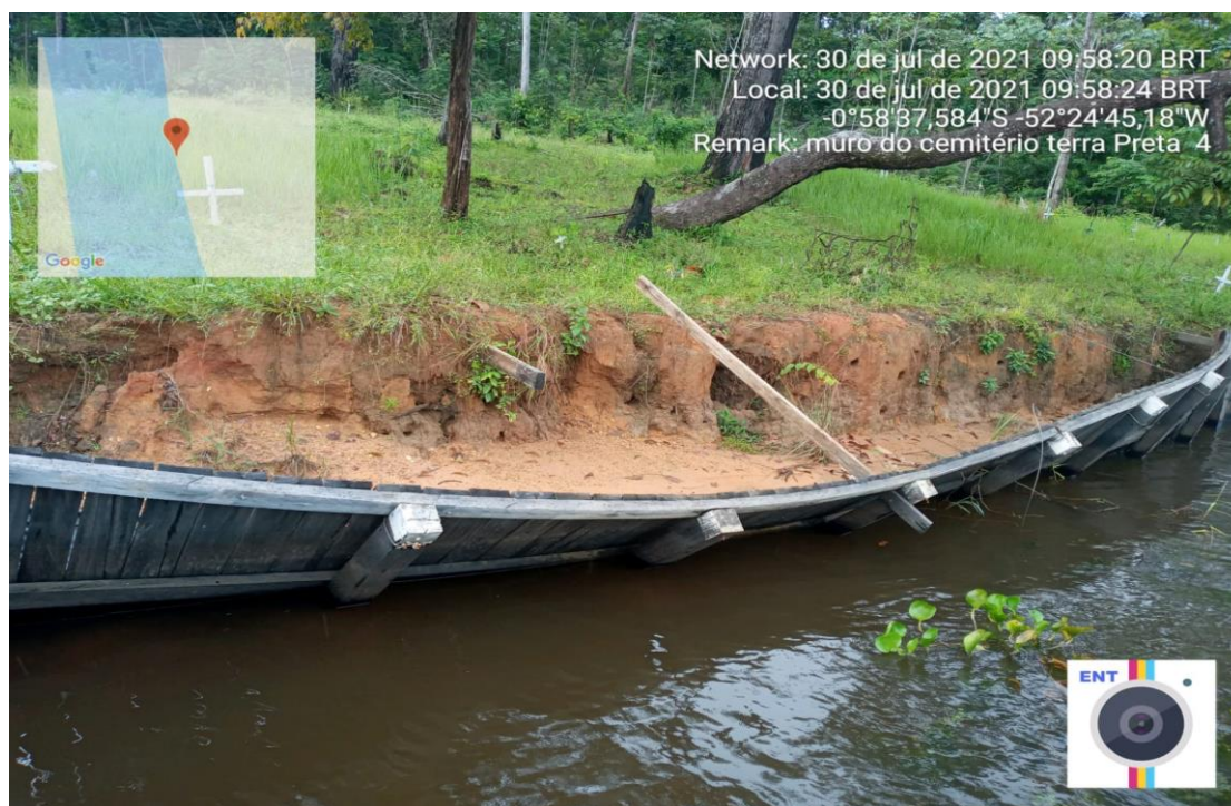
FOTO 07- CEMITÉRIO TERRA PRETA