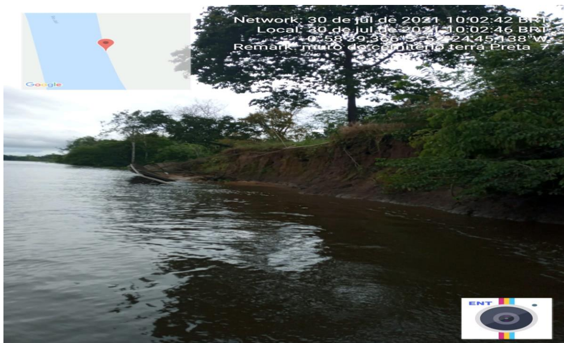
FOTO 05- CEMITÉRIO TERRA PRETA