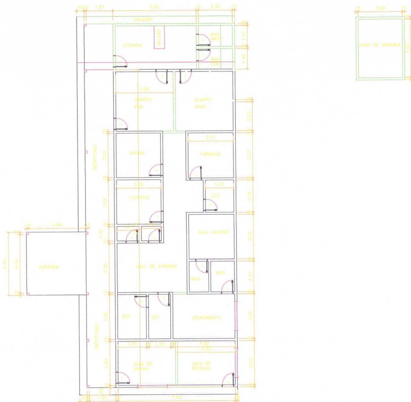
0 PLANTA BAIXA NOVOS AMBIENTES-UBS DO ATERRO ESCALA 1:100

Luci Luciene dos Santos Nascimento TÉCNICA EM EDIFICAÇÃO CREA-0315841346-AP.